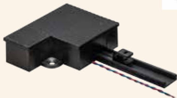
Weichenantrieb , Art.-Nr. 300900