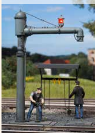
Wasserkran einfach, Art.-Nr. 400450