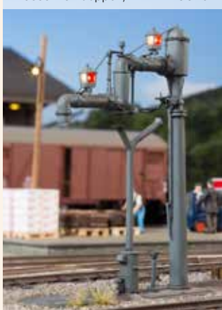
Wasserkran doppelt, Art.-Nr. 400451