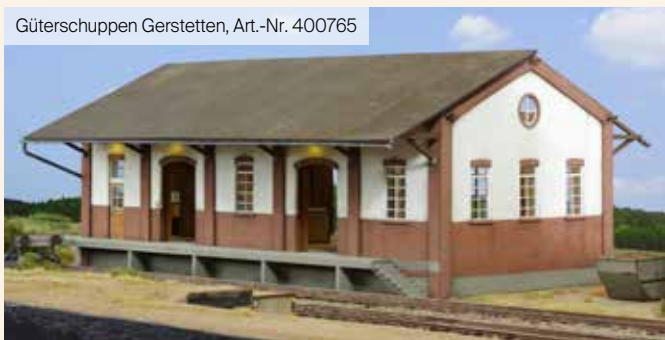
Güterschuppen Gerstetten, Art.-Nr. 400765