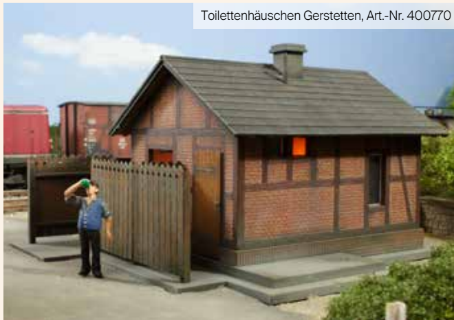
Toilettenhäuschen Gerstetten, Art.-Nr. 400770