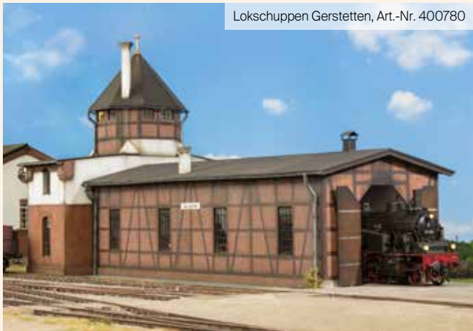
Lokschuppen Gerstetten, Art.-Nr. 400780