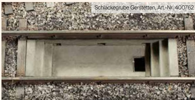
Schlackegrube Gerstetten, Art.-Nr. 400762