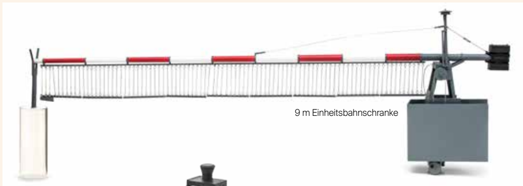
9 m Einheitsbahnschranke