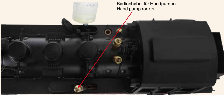
Bedienhebel für Handpumpe Hand pump rocker

Open the water tank hatches, insert the hand pump rocker. Fill proper distilled water into the tanks, close bypass valve, operate hand pump rocker to feed water to the boiler. When the water level on water gauge is high up to \frac{1}{3} , stop pumping water. Open the bypass valve.