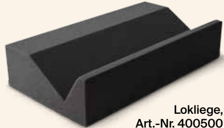
Lokliege, Art.-Nr. 400500

Invert the model on a sponge with cavity to avoid unexpected movements. Using steam oil or matching lubricating oil and place a single drop of oil on all bearing and sliding surfaces. Rotate the wheels to ensure a good cover. Wipe off any surplus with a rag.