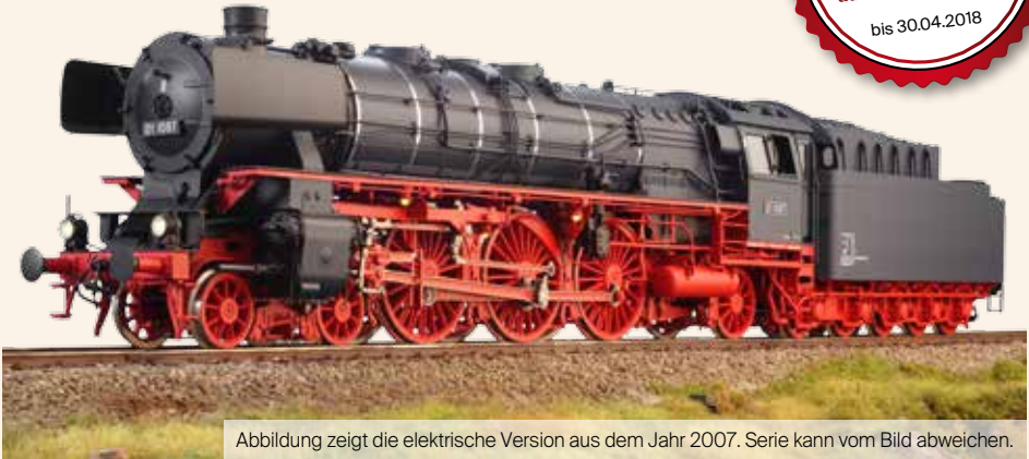
Abbildung zeigt die elektrische Version aus dem Jahr 2007. Serie kann vom Bild abweichen.

Modell: Echtdampfmodell aus Messing und Edelstahl, Brennstoff: Butangas, Achsfolge: 2'C1', Dreizylinderantrieb, Keramikgasbrenner mit Schauglas in Feuerbüchse, Wasserstandanzeige mit Prüfventil, Dampfpeife, nachgebildete Zylinderhähne, Heusinger Steuerung mit Umsteuerung im Führerstand, Kupfer und Edelstahl, silber gelöteter Kupferkessel, Manometer für Kesseldruck, gefederte Achsen und Puffer, Überhitzer, Achsfahrpumpe mit Bypassventil, Handspeisepumpe, Verdrängungsöler, Vorbildgerechte Lackierung und Beschriftung, Modelle mit individueller Seriennummer, komplett lackierte und betriebsbereite Modelle, einstellbare Sicherheitsventile, vorbildgerechte Kupplungen, bewegliche Wasserkastendeckel, zu öffnende Rauchkammertüre, CE zertifizierte und getestete Kessel, streng limitierte Auflage von max. 20 Exemplare pro Version , optionale R/C Steuerung, Mindestradius 2000 mm, LüP ca. 770 mm, NEM-Radsätze.