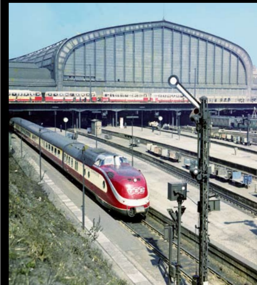
Hamburg Hbf, 6. Juni 1958: „Ausfahrt frei“ für den VT 11.5