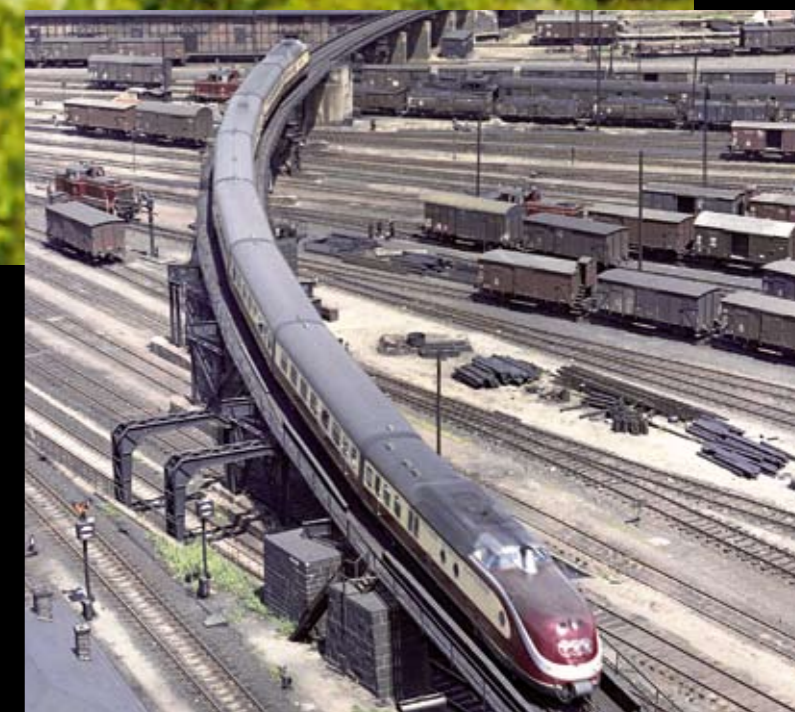
In elegantem Bogen verlässt der TEE Helvetia Hamburg-Altona. Rund 11 Stunden Fahrzeit und gut 960 km liegen bis zum Zielort Zürich vor ihm.

gefertigten Modell wiedergegeben. Das erhabene TEE-Schild, die hochgezogene, runde und bullig wirkende Front mit dem darüber liegenden, leicht abgerundeten, Führerstandausblick geben das typische Erscheinungsbild des VT 11.5 wieder. Die aufwändige Lackierung in beige-rot und Silber stimmt in den Farben wie in der Anbringung der Schwünge und der Farbübergänge mit dem Vorbild überein. Dies gilt auch für den seitlichen, silbergrauen und schwarz schattierten Schriftzug „Trans Europ Express“ an den Triebköpfen. Die Beschriftung ist lupenrein, das Zugleitschild mit den Angaben für die Fahrstrecke des Helvetia von Hamburg-Altona nach Zürich ist in den Türen angebracht.