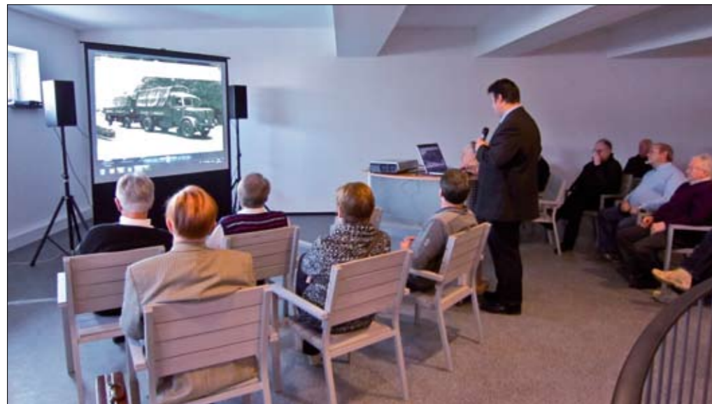
Eines der Veranstaltung-Highlights: Neuheitenankündigung vom „Chef“ persönlich, unter anderem ein Büssing-Transporter