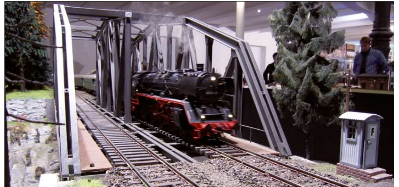
Mit Vollampf geht es in die nächste Runde: Wir freuen uns schon auf weitere 10 Jahre mit Modellen und Zubehör von KM1 in Spur 1!

zählt. Auf den beiden hauseigenen Modellbahnanlagen konnten sich die Besucher von der Detailfülle und den technischen Features der KM1-Fahrzeuge ausgiebig und in aller Ruhe selbst überzeugen. Während im oberen Stockwerk auf der von vielen Messen bereits bekannten Ausstellungsanlage fleißig rangiert wurde, drehten im Erdgeschoss auf einer neu